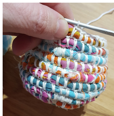
i. Fortsätt tills korgen är klar