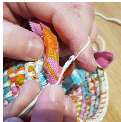
c. Fiska upp