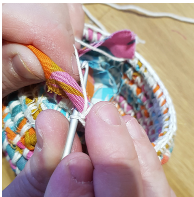
b. Hämta upp