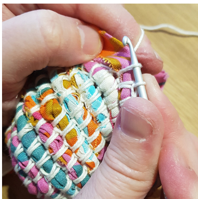
e. Andra maskan