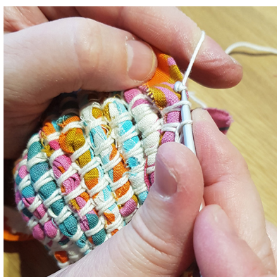
g. Dra igenom den sista