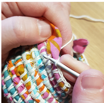
d. Dra igenom