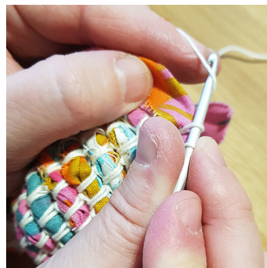
f. Fiska upp ovanför